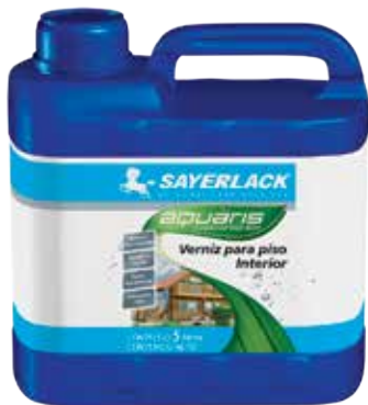
YO40 1464 00 (Semibrilho)