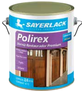
SB 2315 / Cores (brilhante)