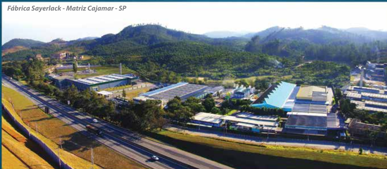
Fábrica Sayerlack - Matriz Cajamar - SP

sayerlack@sayerlack.com.br 0800 702 6666