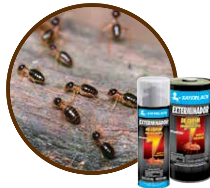
GT 3954 00 (incolor) GT 3954 6095 (marrom)