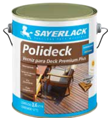
SB 2316 / Cores (semibrilho)