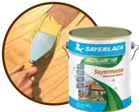
YL 1424 / Cores