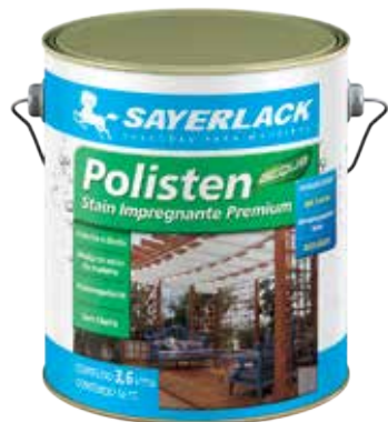
YTS 3912 / Cores