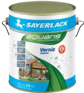
YO30 1453 00 (acetinado)